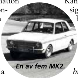
En av fem MK2.

Vet du något mer om dessa bilar? Kontakta redaktionen!