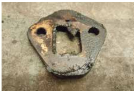
Krypande packningar på bensinpump och ...