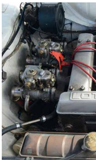
Motorn i en Lotus Cortina 1966.