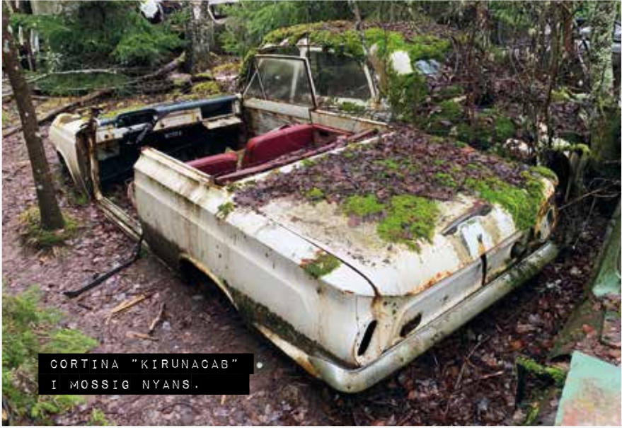
CORTINA "KIRUNACAB" I MOSSIG NYANS.