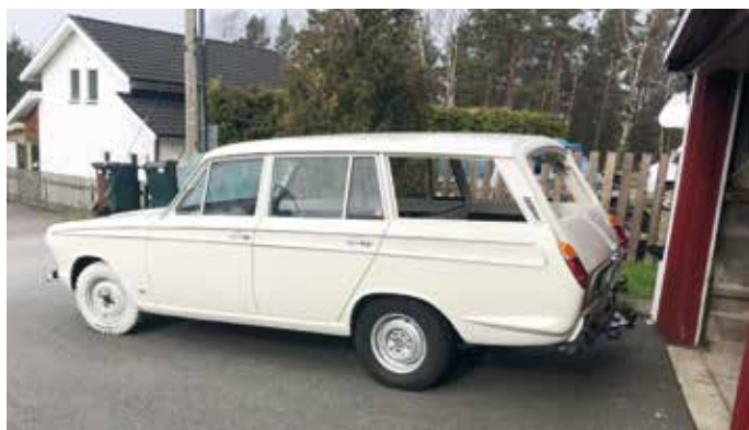
Lite frisk luft och egentid utanför garaget är skönt – även för ett projekt.