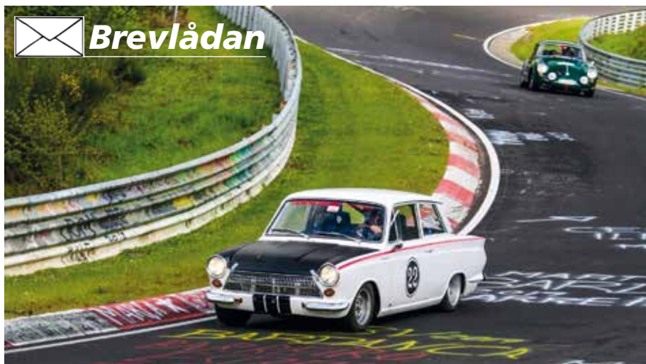
Nordschleife Nürburgring-avsnittet i Brünchen-avsnittet.