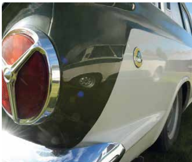
Spiegelblank Lotus Cortina 1966.

– Mina kontakter gör att jag får tag på bilar och kan renovera upp dem för marknaden. De flesta som återfinns har inte varit i körbart skick på länge. Jag ser det som ett kulturbevarande.