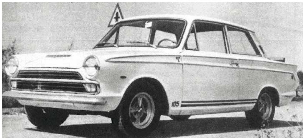
En av tre Cortina GT DeTomaso MK1 som byggdes. Kännetecknen är den dubbla röda randen.

N är det gäller de vassare Cortina-modellerna har vi brittiska Lotus Cortina, australienska Cortina GT 500 och även italienska Cortina GT DeTomaso – en mycket udda bil som bara var tänkt för den italienska marknaden. Någon verklig produktion kom aldrig i gång, så det gjordes bara åtta stycken, varav tre Mk1 och fem Mk2.