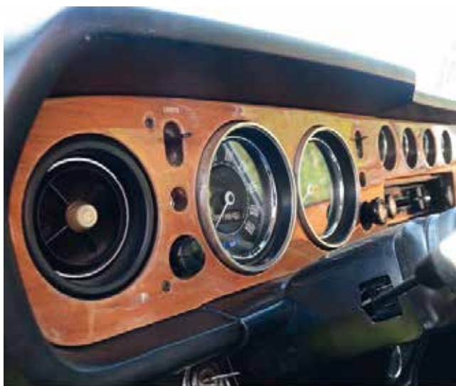
Träpaneler i en (GT) 1600E.