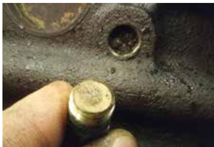
Tydligt tecken – igenkordad avtappningskran.