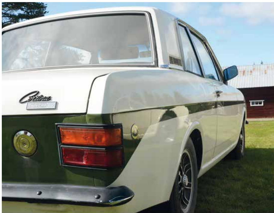
Lotus Cortina 1968 med 135 bromsade hästar.