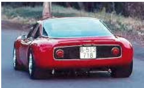
105 hk, DeTomaso-emblem och specialfälgar. Det hela började med sportvagnen Vallenga.

ringen styvades upp och DeTomaso-emblem prydde naturligtvis också bilen. Det finns inte mycket information om de här bilarna, men i kontinental motorpress kan man hitta referenser till dem.