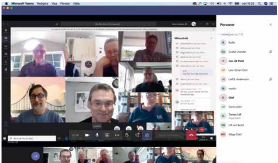
Stämningbild från möteslokalen. Tretton medlemmar – varav två medsuffrare.