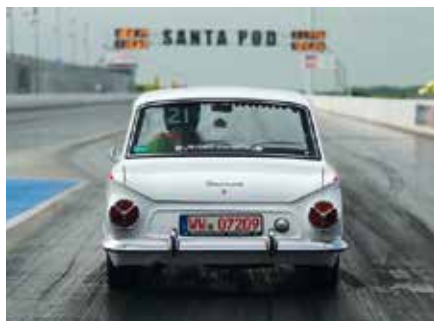
Santa Pod raceway i Northampton i England. 1/4 mil-race – en del av Classic Ford Meeting.