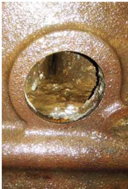
Skönt att spola ur det här gegget.

Så kom våren och läckaget skulle åtgärdas. Motorn togs ur och allt på utsidan skruvades loss. Av gammal vana och princip tar jag ur frostpluggarna, de brukar alltid vara rostiga. Döm om min förvåning när de inte var så dåliga