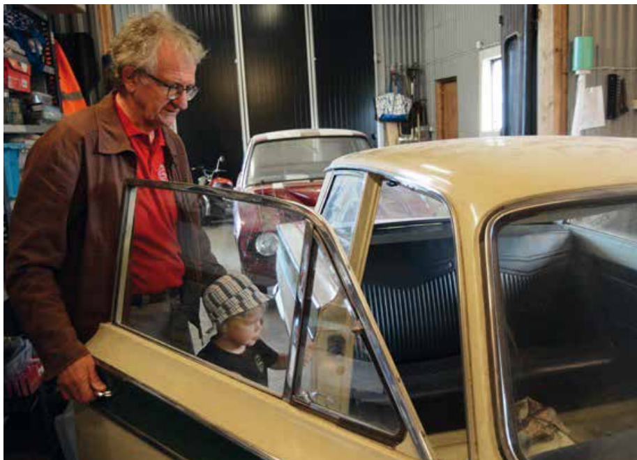
En pågående renovering av en GT 1966 som brunnit under instrumentbrädan. Färgen är ljusgul och inte så vanlig.