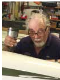
Kent Svensson avled den 13 januari 2020.

Samma motor användes till DeTomasos Cortina bilar. Motorn har dubbla Weber 40 DCOE förgasare, elektrisk bränslepump och DeTomaso skrivet på ventilkåpan. Vidare så bytte man ratt, sätena byttes till Recarosäten, fälgarna till Campagnolo lättmetalls dito, fjäd-