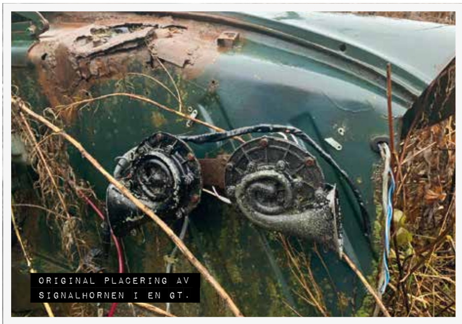
ORIGINAL PLACERING AV SIGNALHORNEN I EN GT.