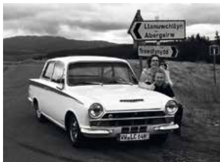
Samma bil, men nu med tyska skyltar, på Snow Wales – en rundtur i norra Wales.