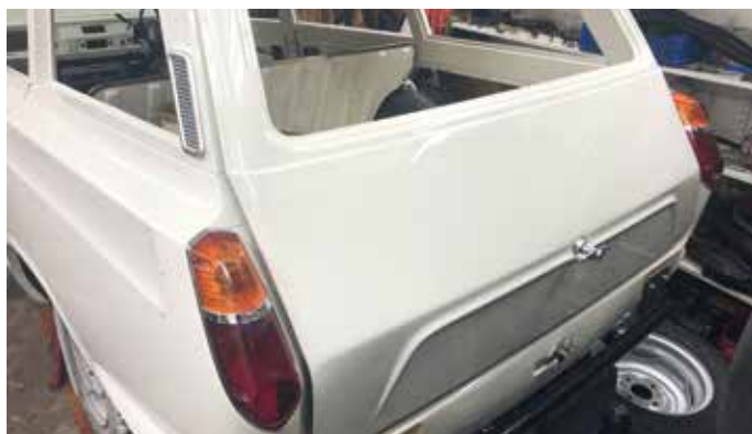
En härlig vy att beskåda innan kromlister har hunnit pryda karossen.