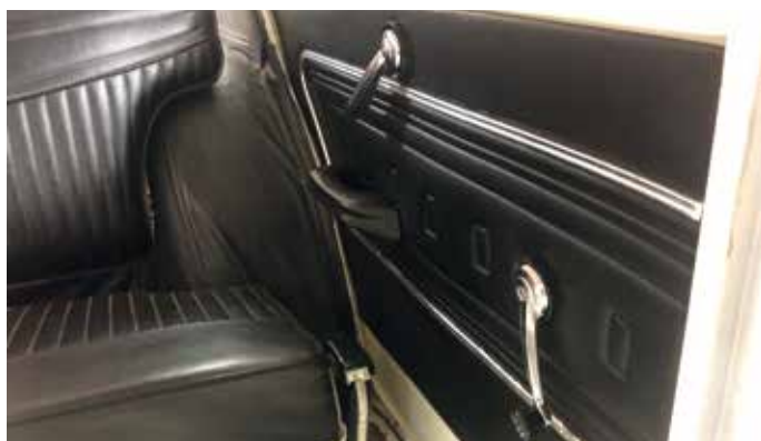
Ett litet smakprov på hur det kommer att se ut inne i kupén när bilen så småningom glider fram på våra svenska vägar.