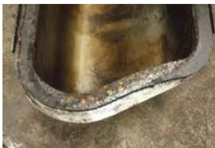
... ventilkåpan bidrog till läckaget.