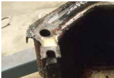
Fattas en bit här.