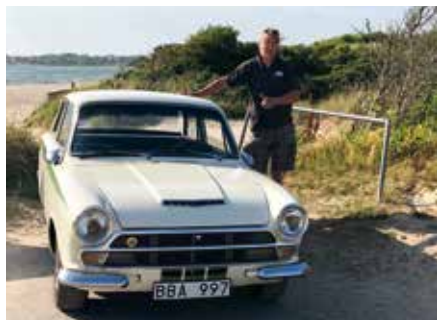
Första resan med Lotus Cortinan till stranden i Båstad efter köpet.