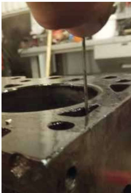
35 mm sörja var det i blocket!

bak på motorns vänstra sida, kommer det inte ut något är det dags för rengöring. I detta fall så kom det inte ut nåt ens när hela kranen var urskruvad!