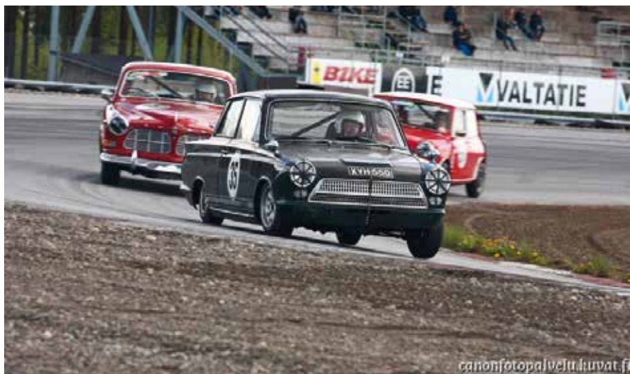
Kemora 31 maj 2015. Säsongsens första race . Banan var lite lätt fuktig vilket gjorde att jag lätt körde förbi Amazonen och Kojan, men direkt det torkade upp hade jag svårt att hänga med.

Efter cirka 20 minuter, efter att Bertil formligen hängde ut på banan över räcket, så förstod jag att nu var det dags för förarbyte.