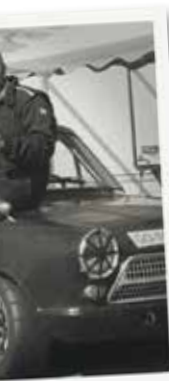
Botniaring 2014. Fotot tog min kompis och stylade bilden så det skulle se ut som 1967. Fast det var ju då som jag föddes...