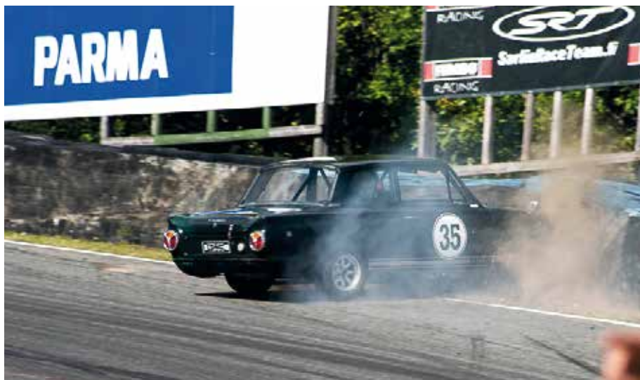
Historic Grand race 15 augusti 2015. På första träningen gjorde en nödigt BMW 2002 på sig och banan blev oljehal, varpå Cortinans däck inte fann något fäste utan skurrade rakt in i däckvallen.